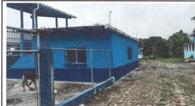
Foto 5: Pintura en Muros Exteriores e Interiores, Reparación de muro perimetral de block y repello en muro.