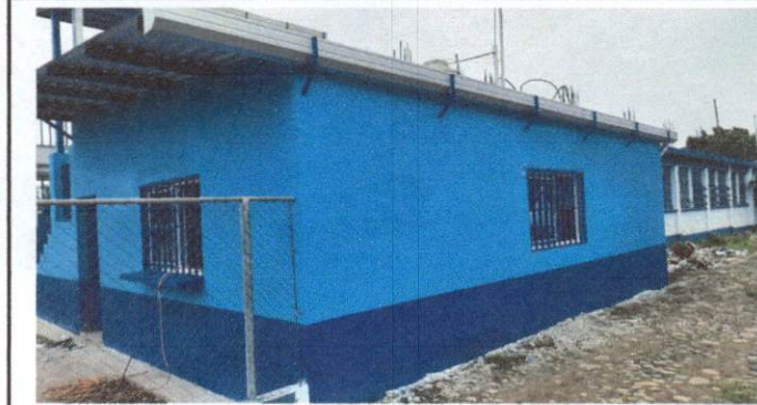
Foto1: Sustitución de lámina, por lámina troquelada Aluzinc, calibre 26